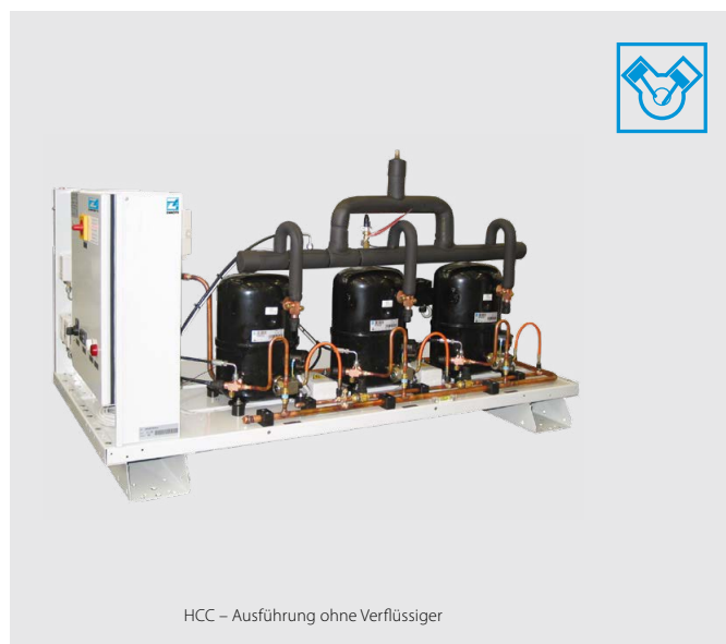
HCC – Ausführung ohne Verflüssiger