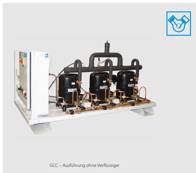
GCC – Ausführung ohne Verflüssiger