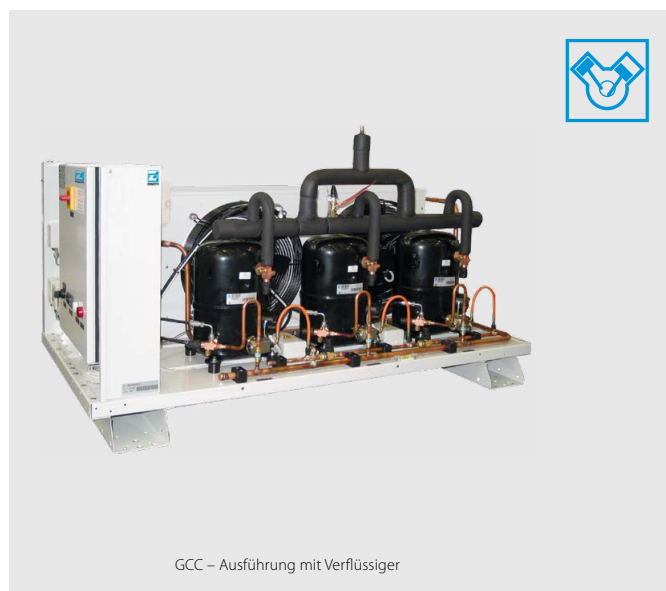
GCC – Ausführung mit Verflüssiger