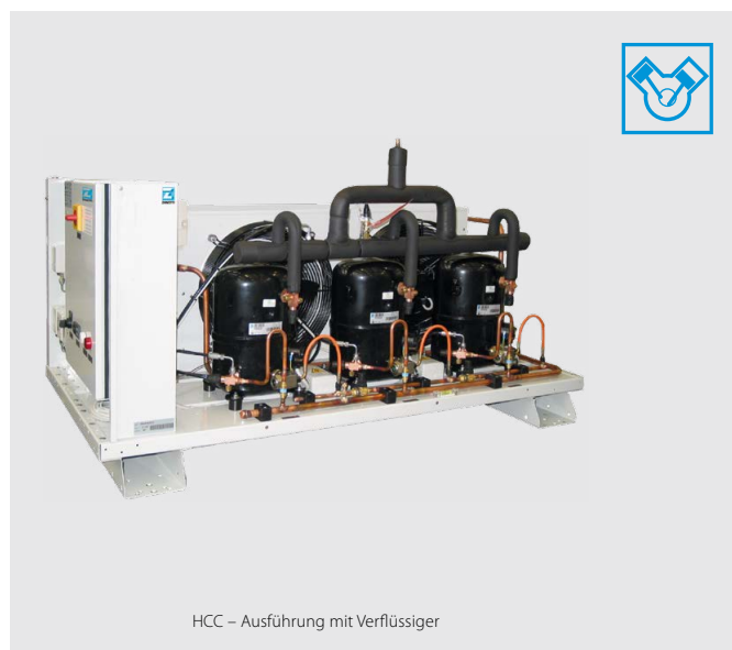
HCC – Ausführung mit Verflüssiger